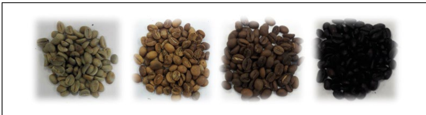
Figura 1. Grados de tueste del C. arabica variedad Típica. De izquierda a derecha: granos de café, granos de café claro, medio y oscuro después del tostado artesanal.

Los granos verdes C. arabica variedad Típica fueron originarios del estado de Oaxaca y mediante un tostado artesanal se obtuvieron tres grados de tueste: claro, medio y oscuro.